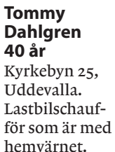
Tommy Dahlgren 40 år Kyrkebyn 25, Uddevalla. Lastbilschaufför som är med i hemvärnet.